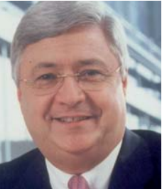
Klaus-Peter Müller, Präsident des Bankenverbandes