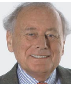
Reinhold Würth, Unternehmer und Stifter